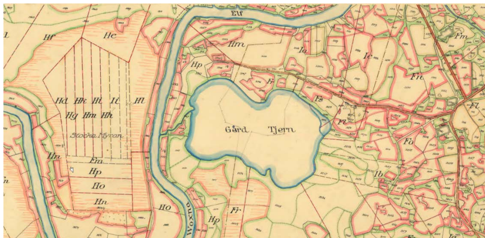
Karta från laga skifte, sent 1800-tal