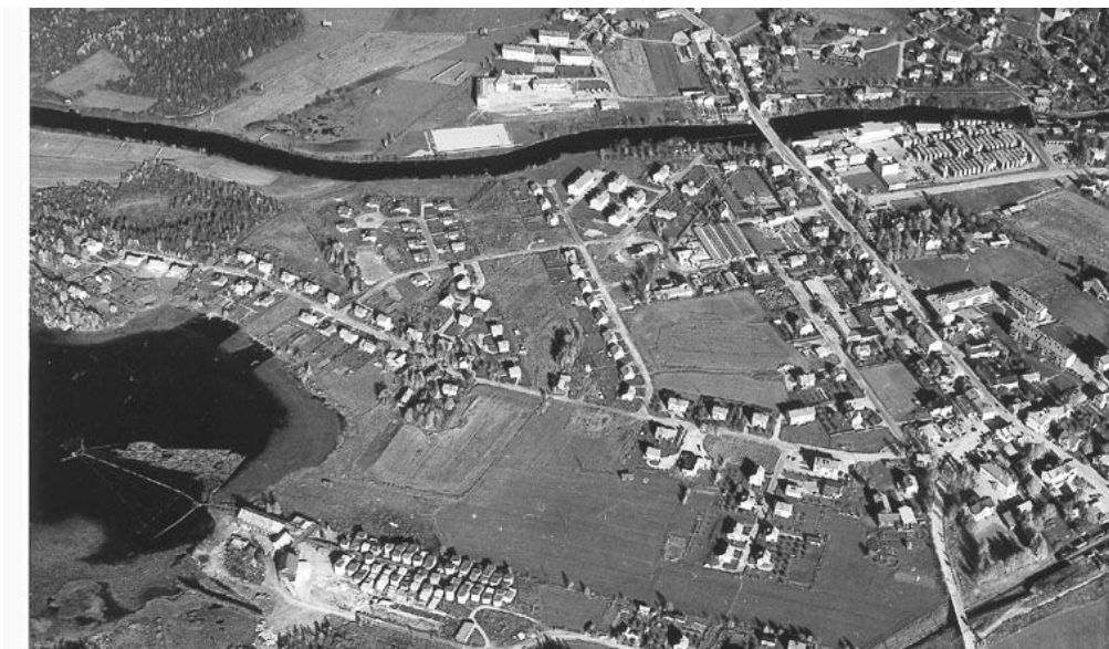
Gammal flygbild (före 80-talet) där den del av Gårdtjärn där förbindelsen enligt vissa källor ska ha funnits framgår.

Man kan således konstatera att det nog finns delade meningar om huruvida en förbindelse med Voxnan åt norr har funnits eller inte och även om det vore tillfredsställande att ha ett absolut svar, så är det i dagsläget mycket intressantare att i stället lägga tid och energi på att titta framåt för att se hur Ovanåkers kommun skulle kunna hjälpa till att förbättra vattenkvaliteten samt stärka Gårdtjärns värden.