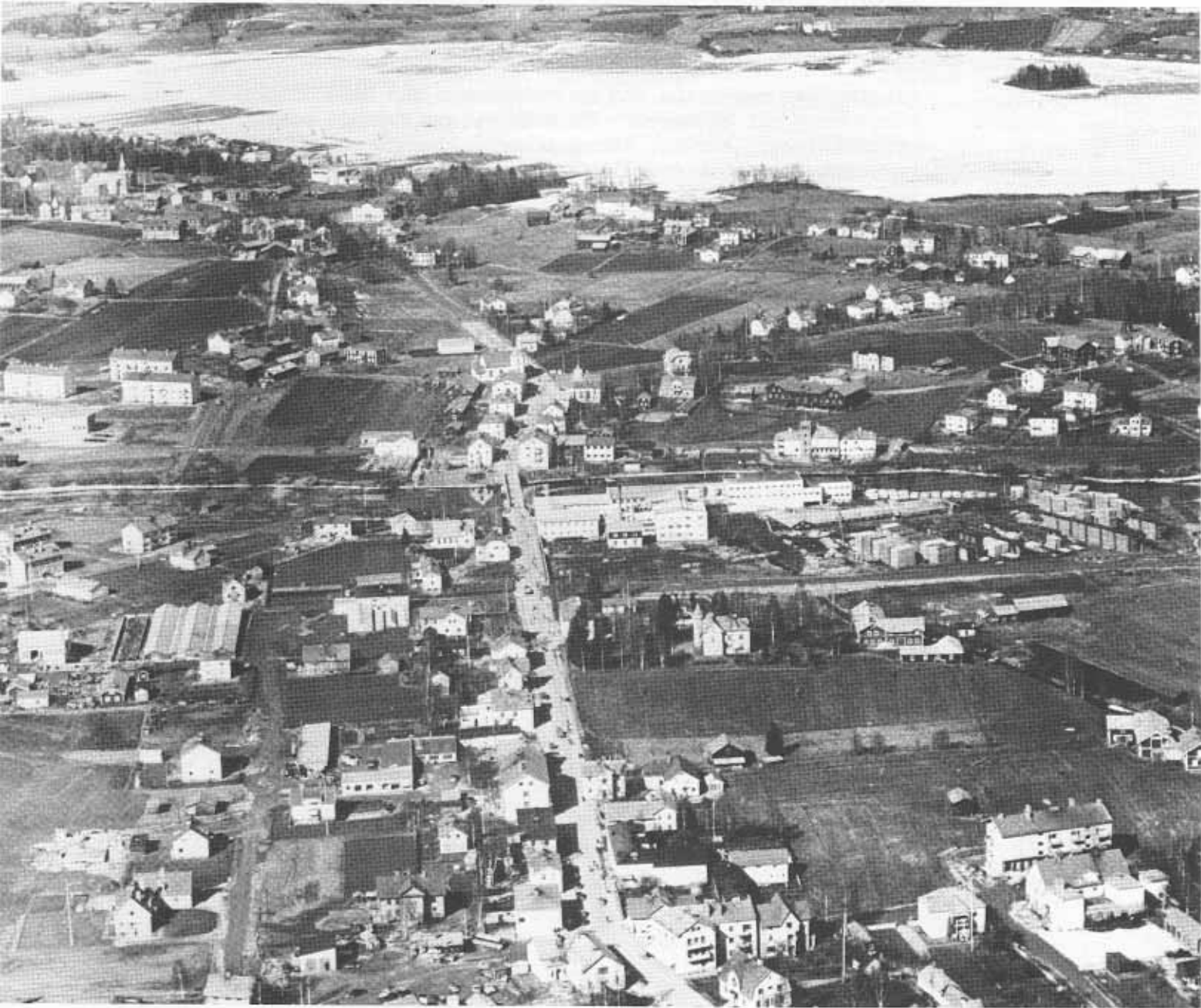
Flygfoto över centrala Edsbyn mot norr, omkring år 1950.