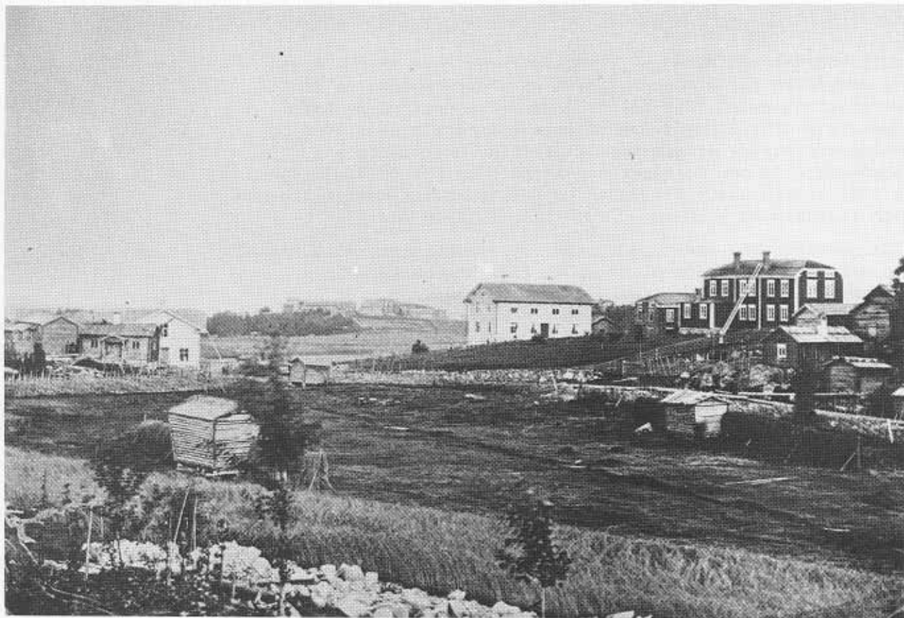
Från höger syns gårdarna Backa, Olanders och Ol-Nilsens tätt sammanbyggda, Föreningen(tv). Fotot från 1873 visar vad som senare skulle kallas Norra torget, dvs korsningen av Voxna/Ovanåkersvägen och Ullungsforsvägen. Linladan (tv) står idag på hembygdsgården.