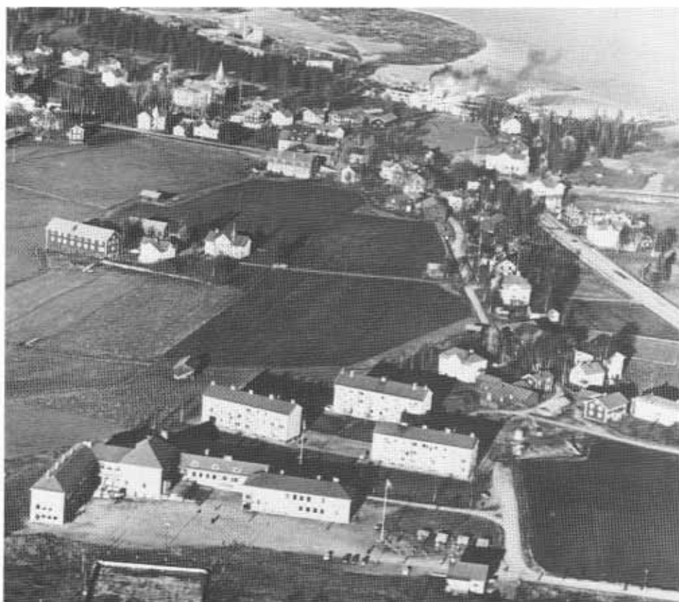
I nedre bildkant Celsiusskolan och bostadsområdet Gärdet. Från 1960-talet.

Även på andra håll i samhället uppfördes bostäder under 1950-talet. Utbyggnaden av Näsområdet fortsatte med enfamiljshus. Enstaka småhus byggdes även i Borgen och kring Gårdstjärn.