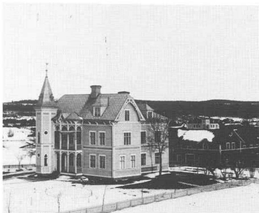
Öjevillan som uppfördes 1909 efter ritningar av Olof Johansson föreslås bli byggnadsminne.

Ärenden som rör dessa byggnader skall prövas särskilt efter samråd med läns museet. Det är viktigt att ytterligare förvanskning kan hindras och att ett återställande kan ses som mål vid bygglovsprövning.