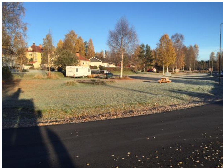
Kort taget i riktning enligt pilen på kartan ovan.