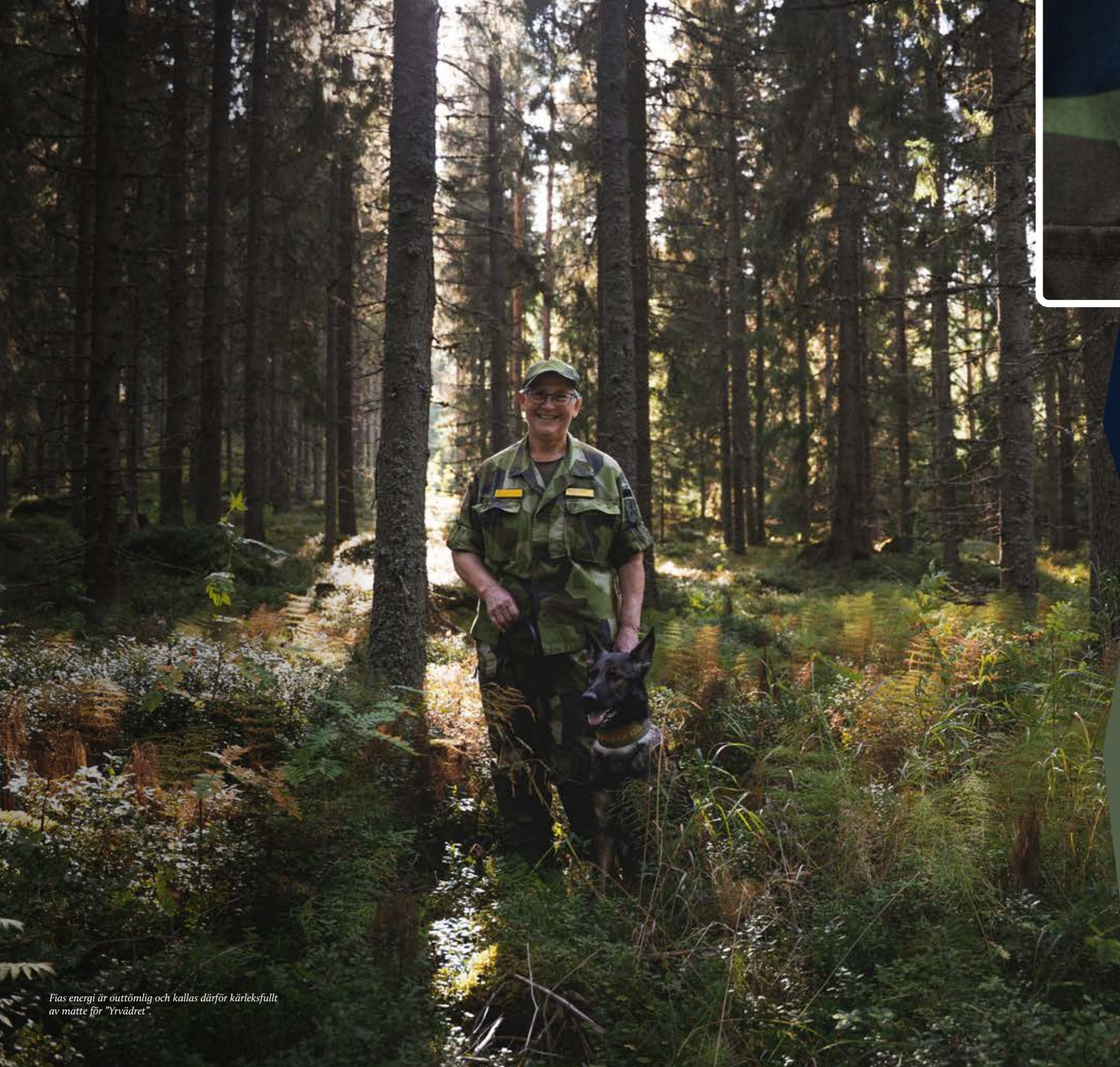
Fias energi är outtömlig och kallas därför kärleksfullt av matte för "Yrvädret".