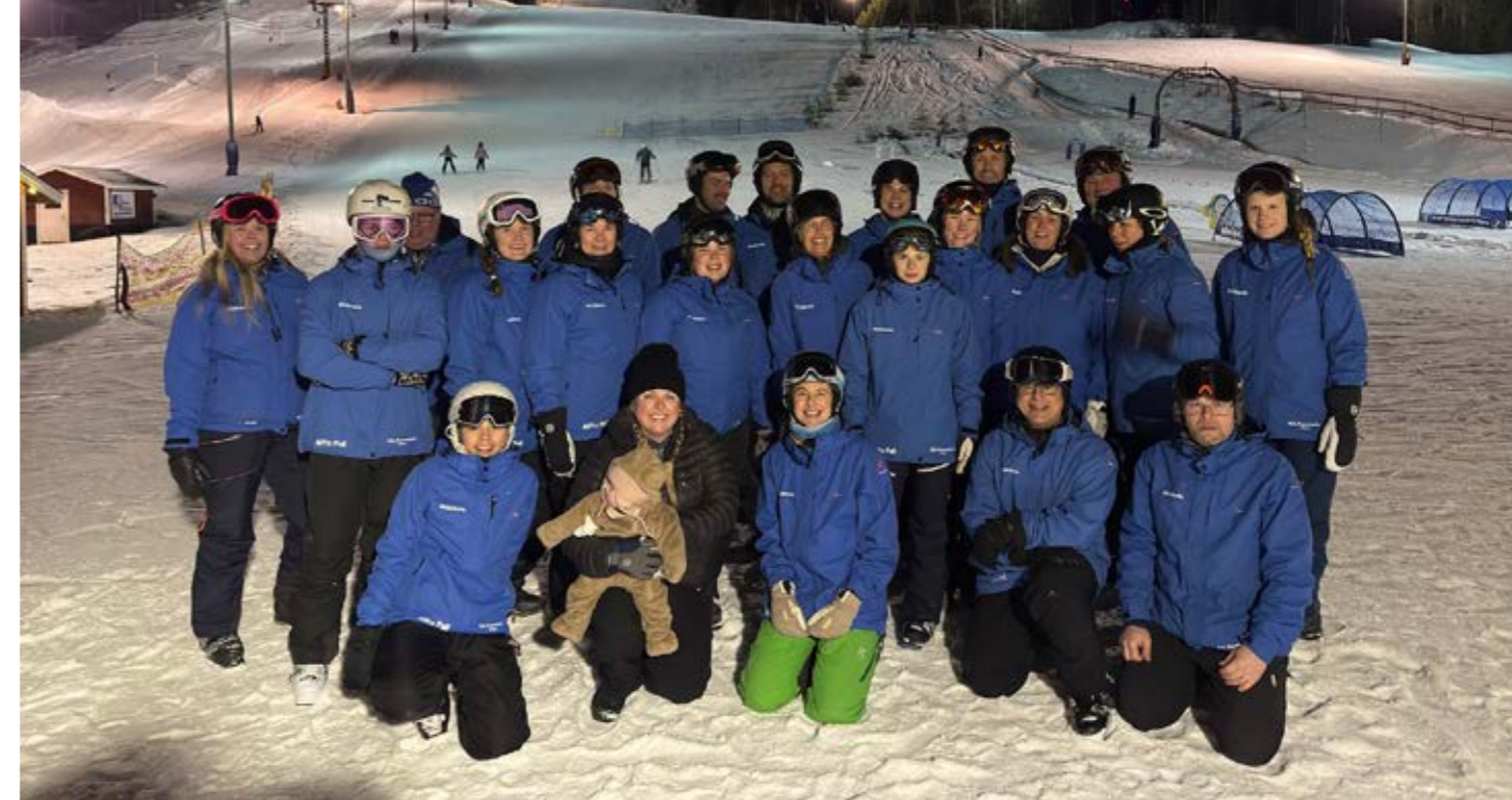
Friluftsförbundets engagerade ledare får tillsammans verksamheten att gå runt.