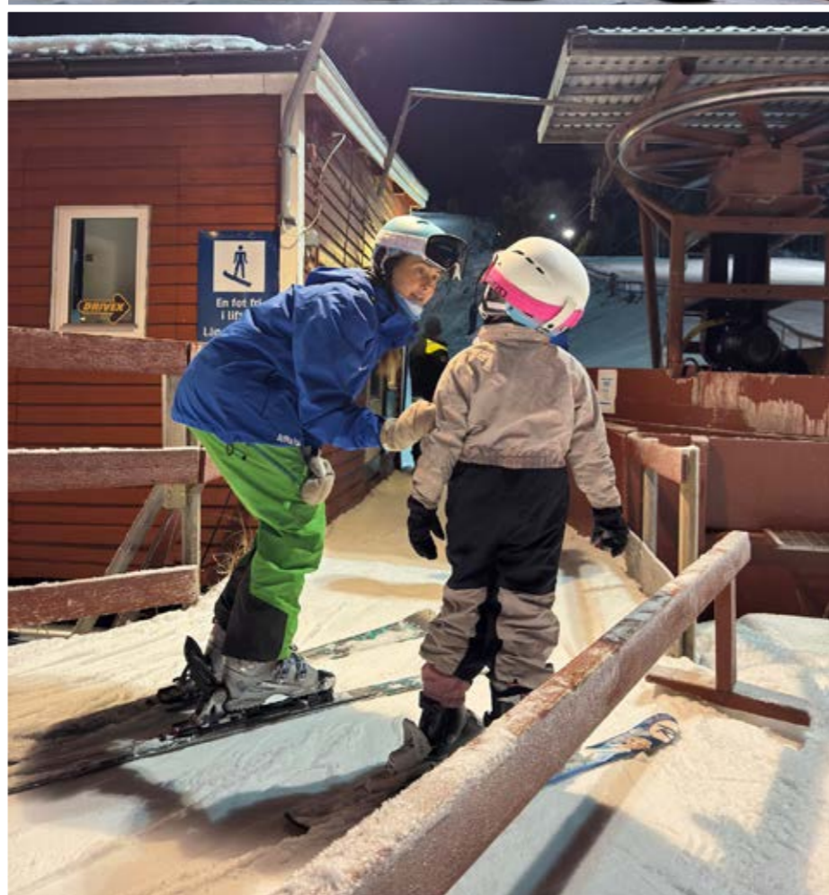
Med ledarnas hjälp lär sig eleverna att bemästra skidliften.